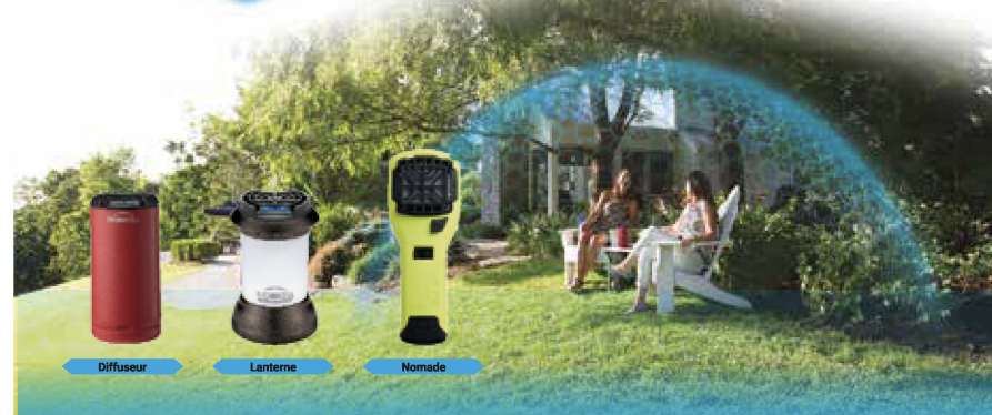
Diffuseur Lanterne Nomade

PROFITEZ DE VOTRE EXTÉRIEUR EN TOUTE SÉRÉNITÉ !